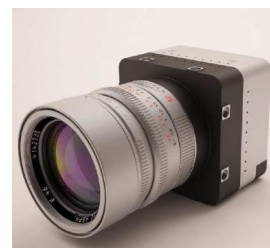
Caméra légère du LOEMI